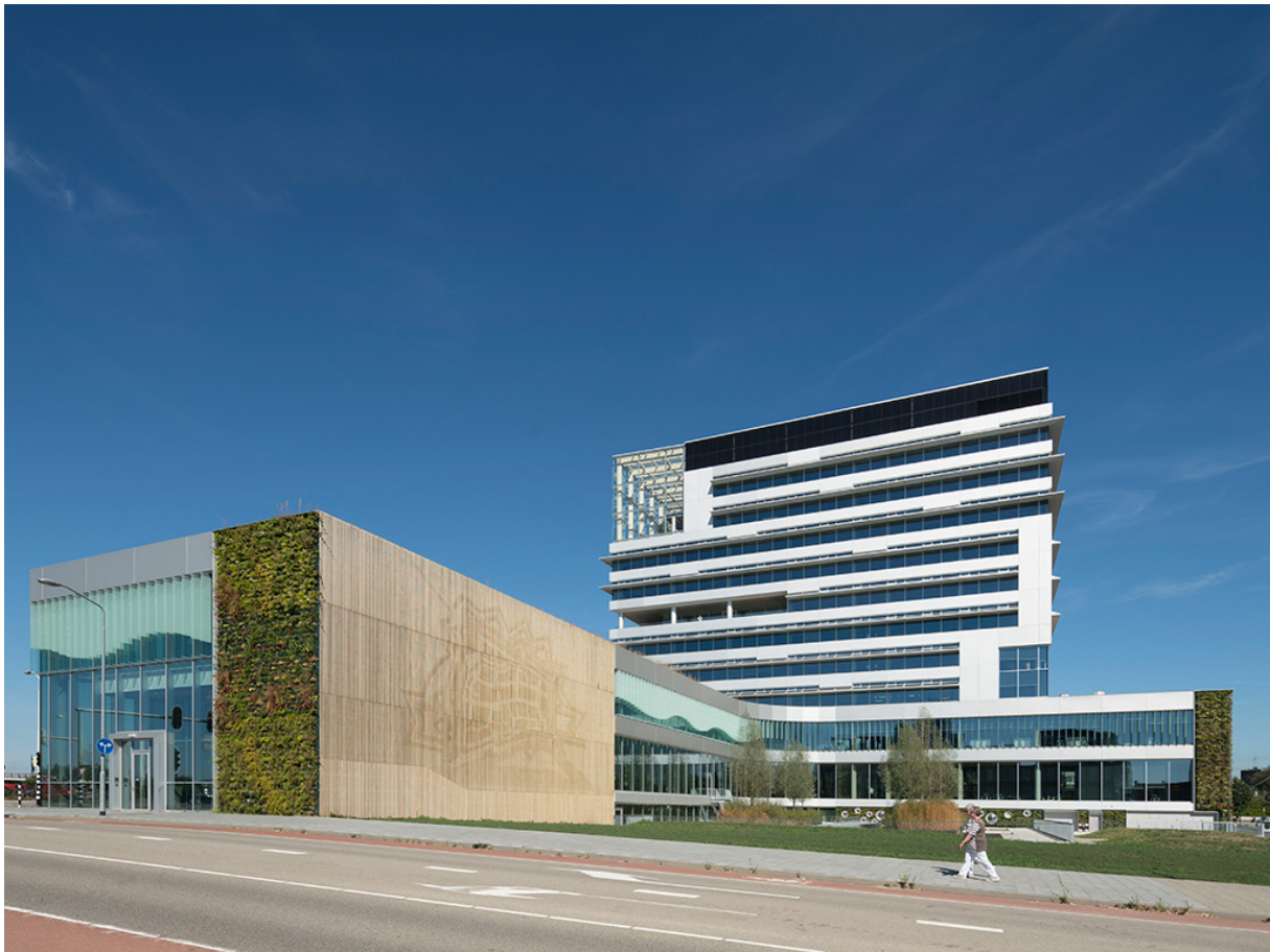
Het stadskantoor in Venlo van de achterzijde. Het atrium is goed zichtbaar.

Op http://www.rau.eu/liander/ zijn beelden te zien van het Liander gebouw in Duiven.